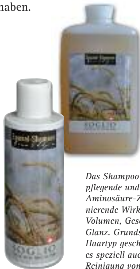
Als 200-ml- und als Liter-Nachfüllflasche

Kontakt mit der bäuerlichen Vermarktungsorganisation wurde 2009 das Spezialshampoo Gran Alpin zur Pflege von fettigem, aber auch trockenem Haar geschaffen. In diesem charaktervollen Produkt findet die altüberlieferte, pflegende Wirkung von Gerstenwasser auf Haut und Haar eine ideale Anwendung. Das Shampoo ist aber auch Symbol für die Zielsetzung zweier Unternehmen, die sich ganz der Förderung des Berggebietes verschrieben haben. ■