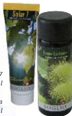
Solar 7 Tube, 75 ml

Das Acqua Castanea von SOGLIO ist ein mildes Rasierwasser mit einem wässrig-alkoholischen Auszug von Kastanienblättern und erfrischt mit einem angenehm milden Duft von Orangenblüten. Bei der Solar 7 ist es ebenfalls ein Auszug aus Kastanienblättern, der zu einer guten und verträglichen Schutzwirkung beiträgt.